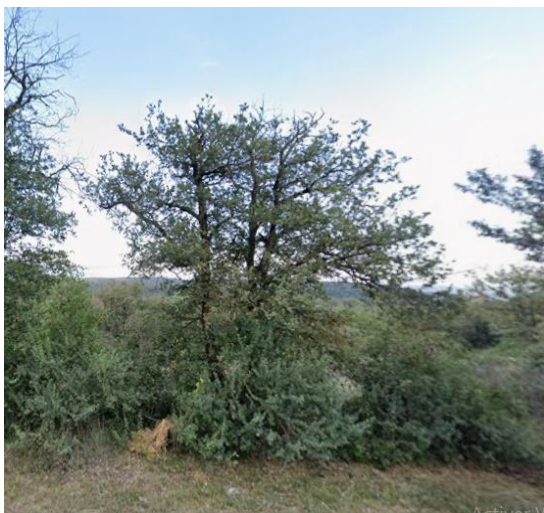
Arbre no representat o representat com a taca de verd impassable.