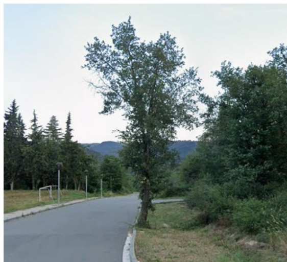
Arbre clarament aïllat amb una base neta representat com a arbre singular o normal.